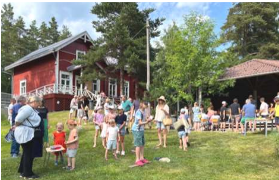
Vädret var fint på barnfesten som vanligt.