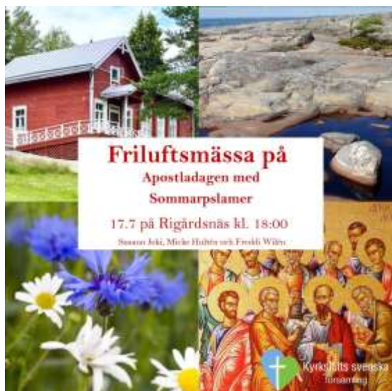
Kyrksläotts svenska församling bjöd in till friluftsmässa med sommarpsalmer den 17 juli. Rigårdsnäs vackra omgivning gav en fin ram åt evenemanget.